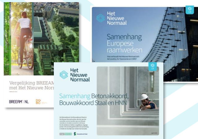
Samenhang HNN met toelichting op relatie tot andere raamwerken