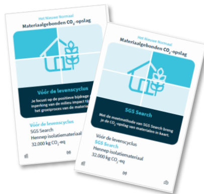
HNN Kwartet voor beter leren kennen van thema's