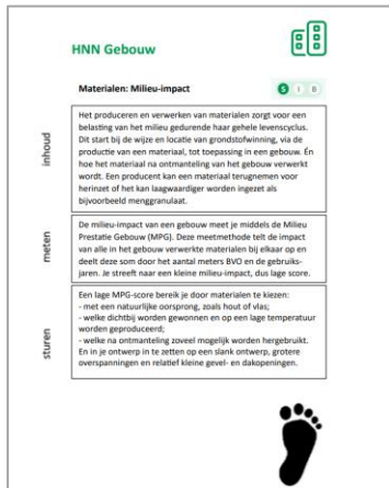
HNN Starterskit met ontwerpprincipes