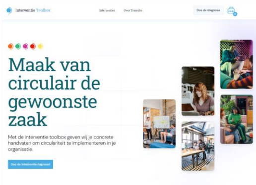
HNN Interventietoolbox met tips voor jouw organisatie