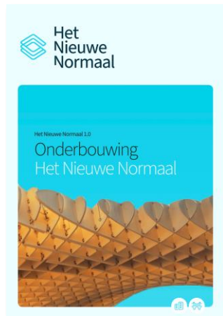
HNN Onderbouwing met verdieping op prestatieniveaus