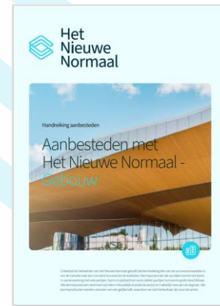
HNN Inkoopleidraad voor aanbestedingen